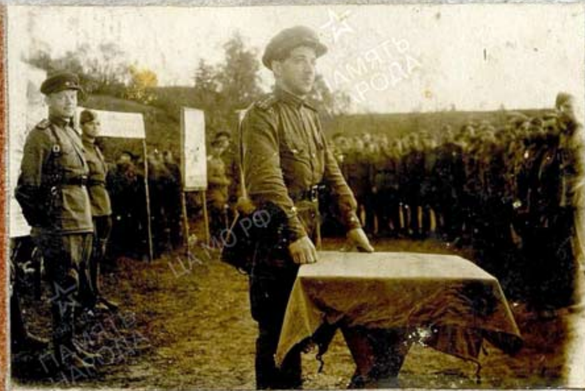
Роты и взводы в Рязанской области всех родов войск. 1941-42 гг.