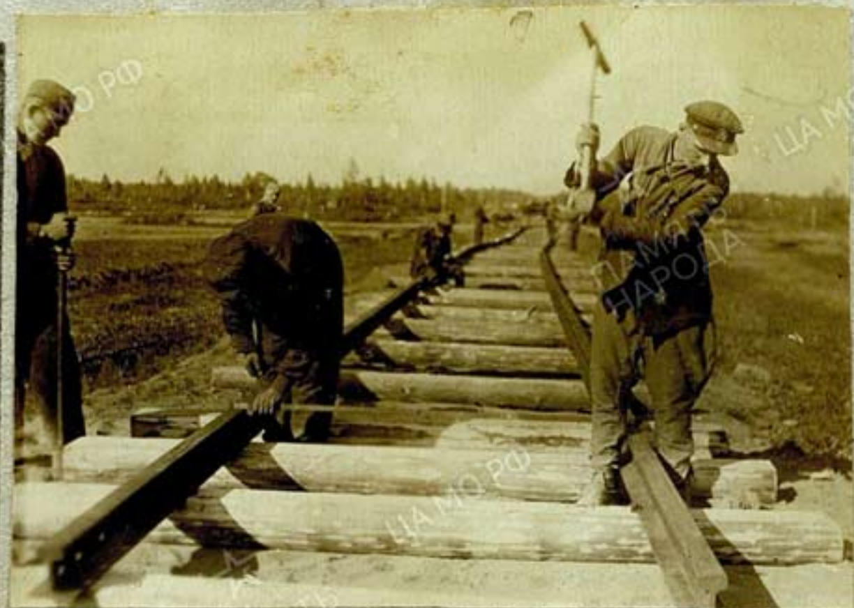
Закладка шпал на линию Бугорный - Луки июль 43