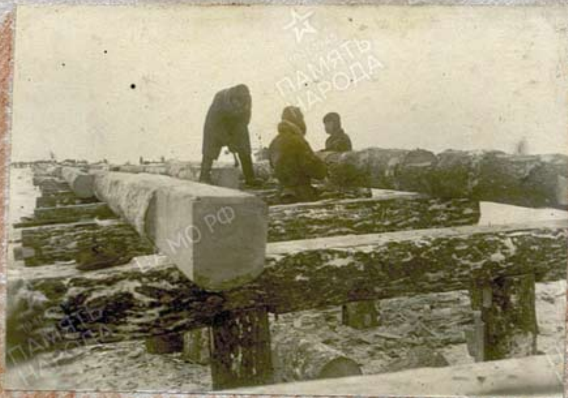
Протеска прогонов и постановка их на насадки.