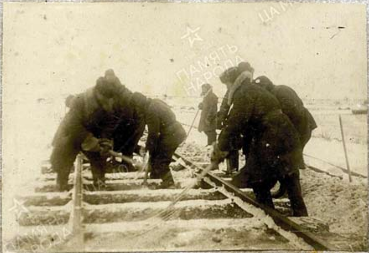
Очистка пути от снега для подготовки к подземке на балласт 4 й поселка