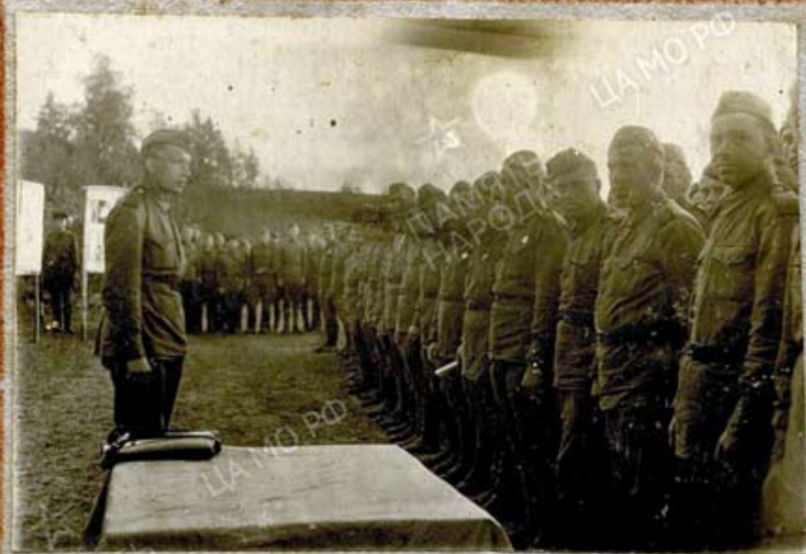
Взводная часть в Рязанской области