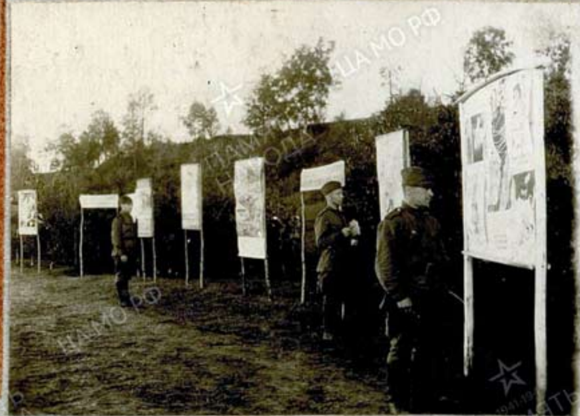
Взводная часть в Рязанской области для всех родов войск. 1941-42 гг.