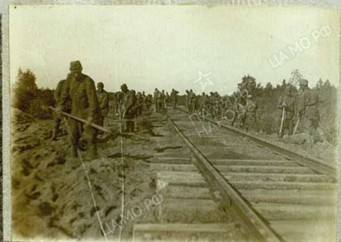
Подготовка шпал на балласт Бугорный - Луки июль 1943