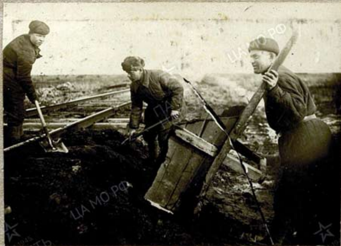
Плачевная возка балласта. 2 й поселок. Февраль-1942.