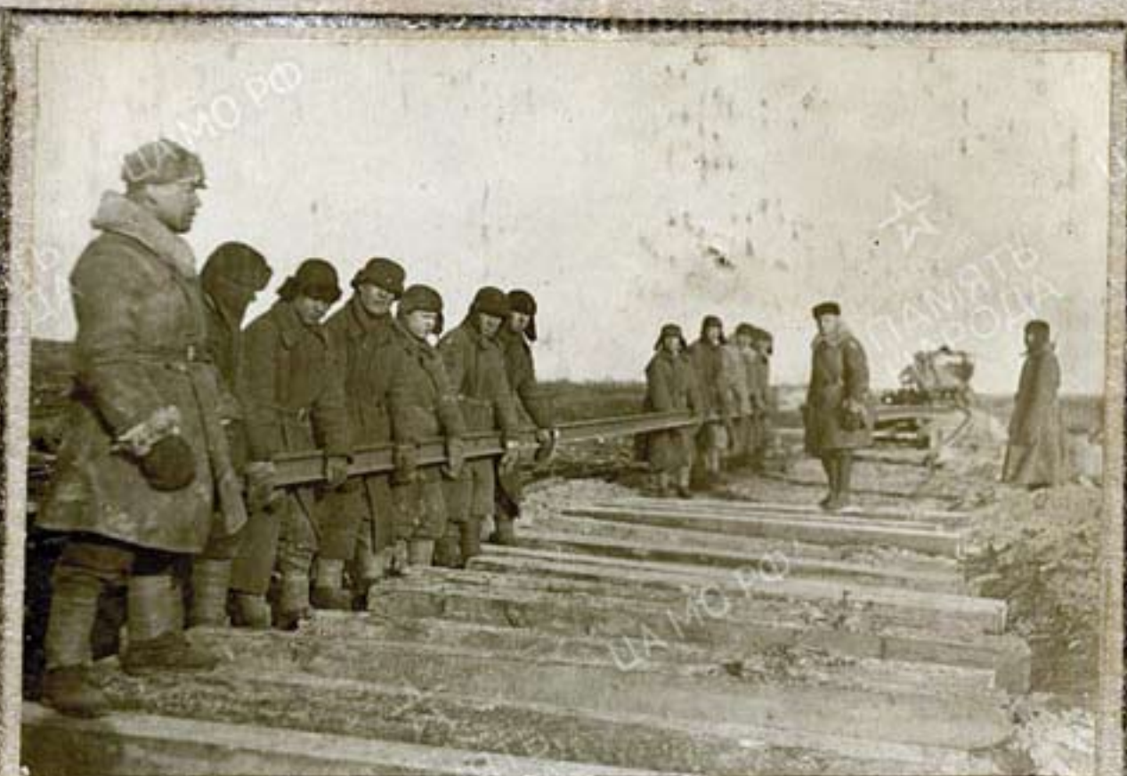
Укладка пути на Ленинград, р-н Синявино февраль-1943г.