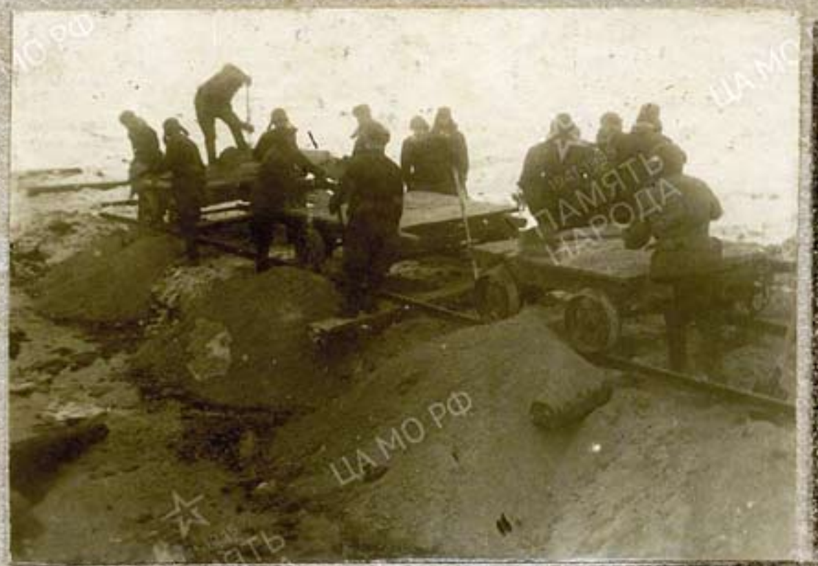
Возка балласта вагончиком для подзетки пути. 4й поселок, февраль 1943г.