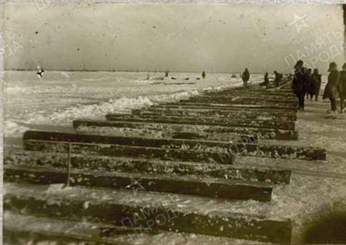
Раскладка поперечин для укладки узкой колеи на Ленинград.