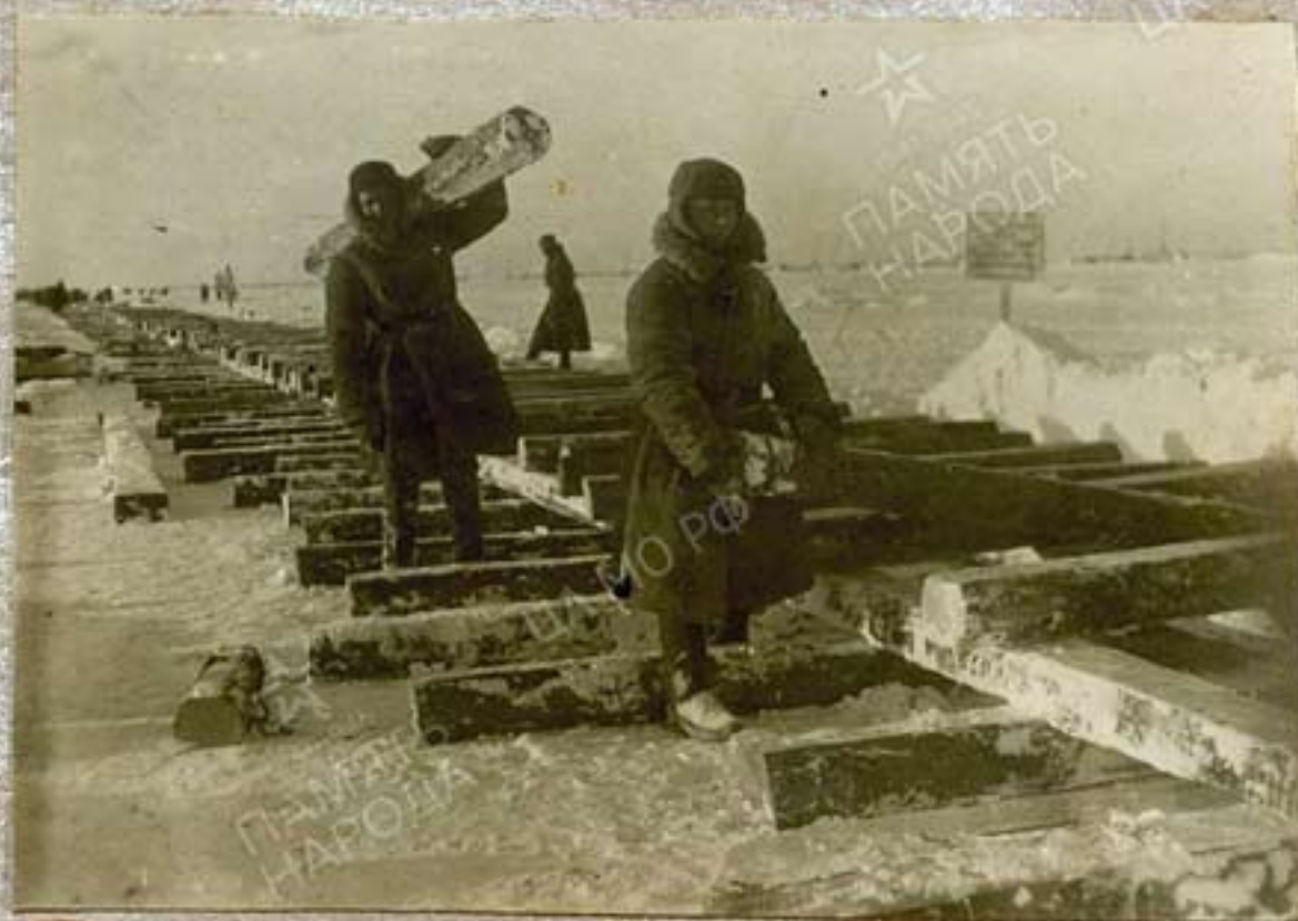
Раскладка шпал под узкую колею.