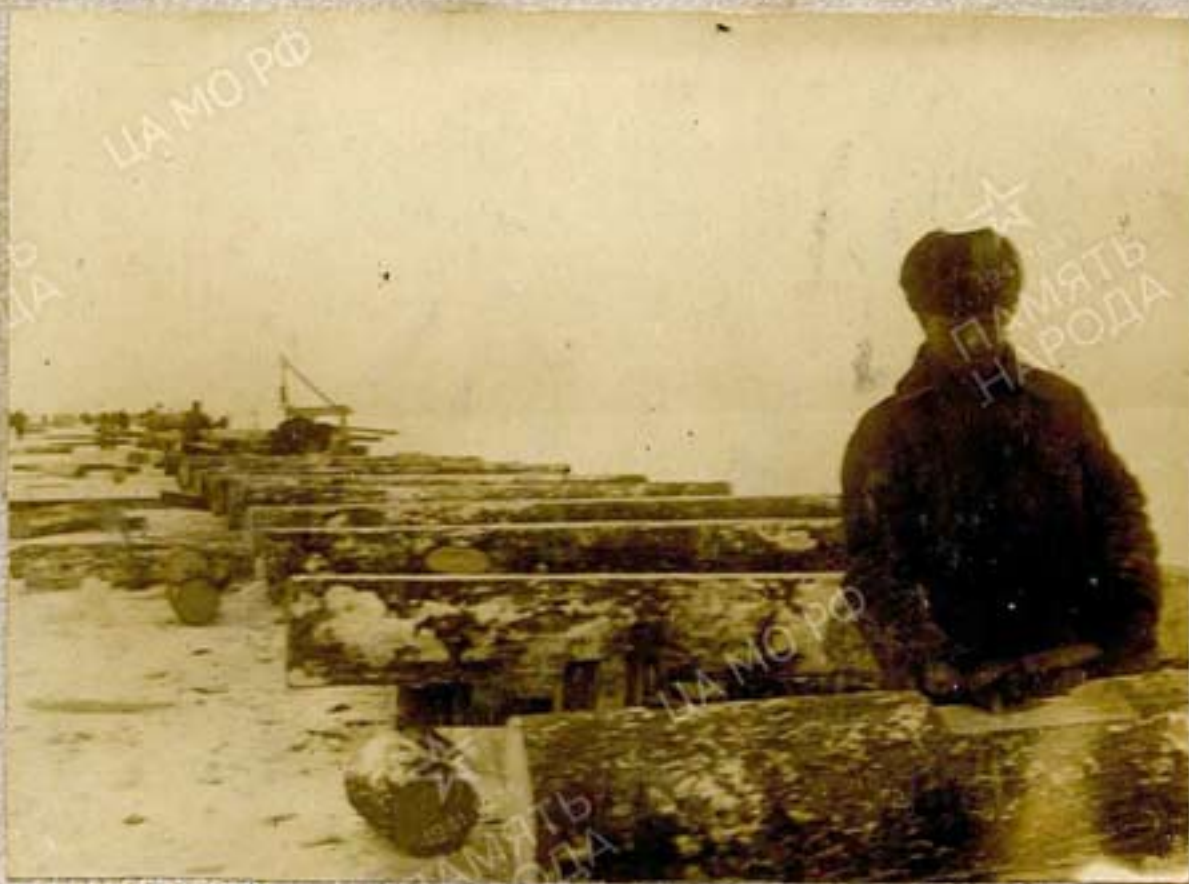
Выравнивание по уровню насадки.