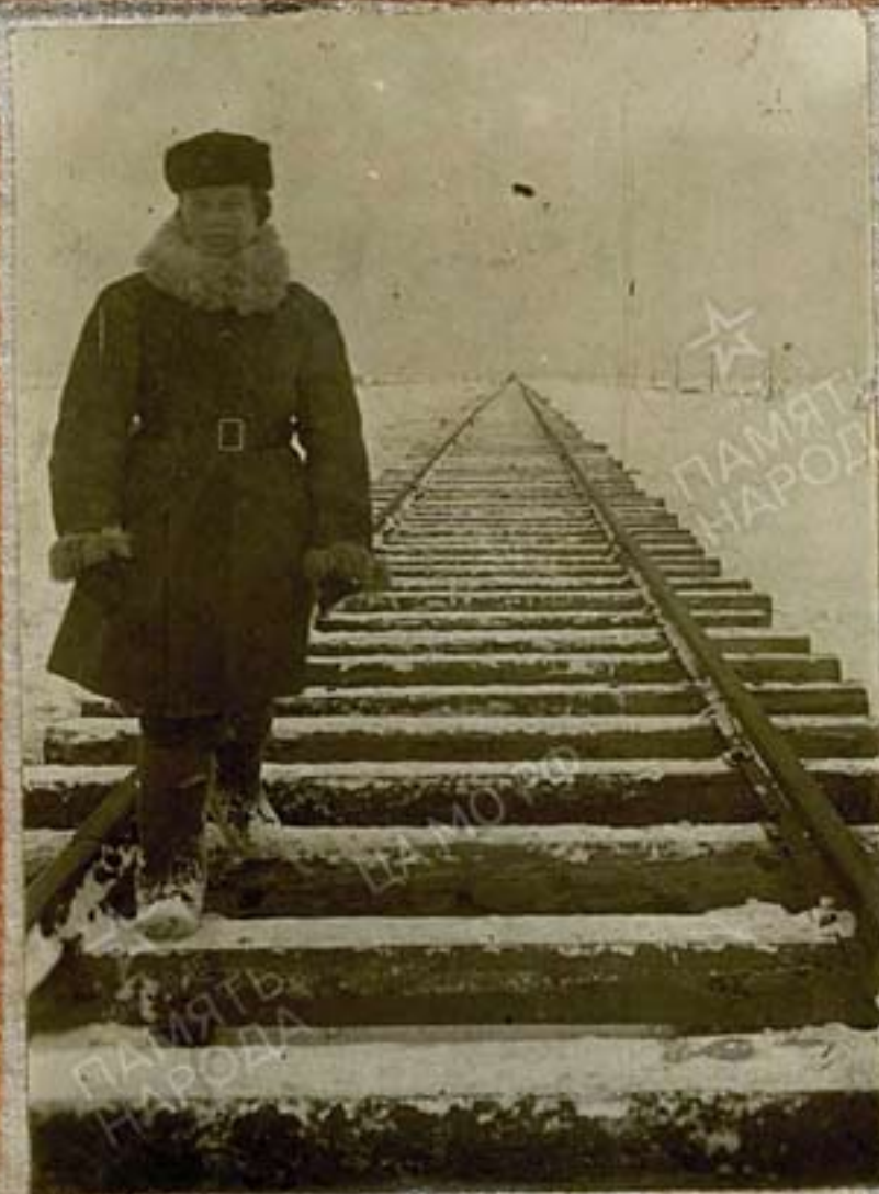
Путь на Ленинград проложен вид с Восточного берега Ладож- ского Озера. 17 января 1943г.