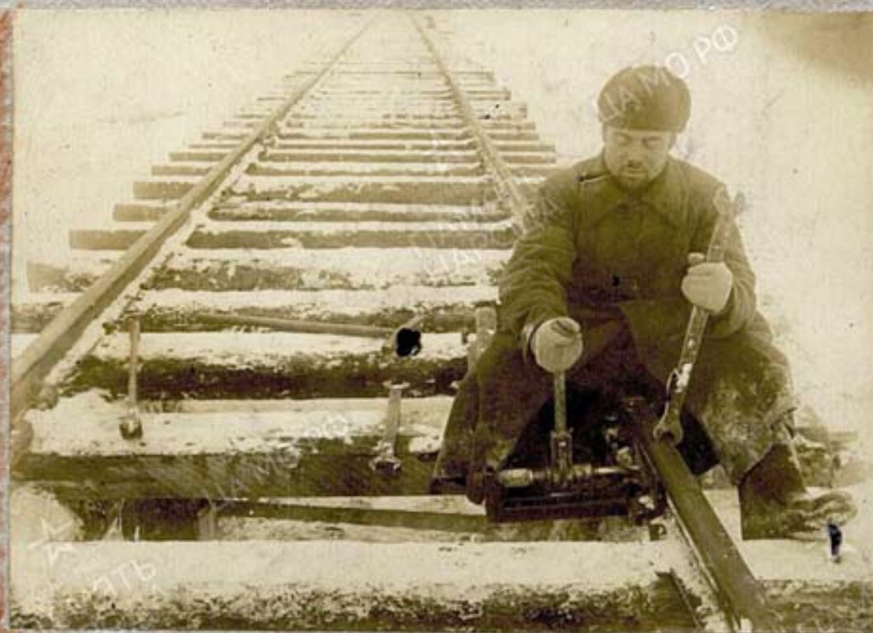
Сверление дыр в стыках.