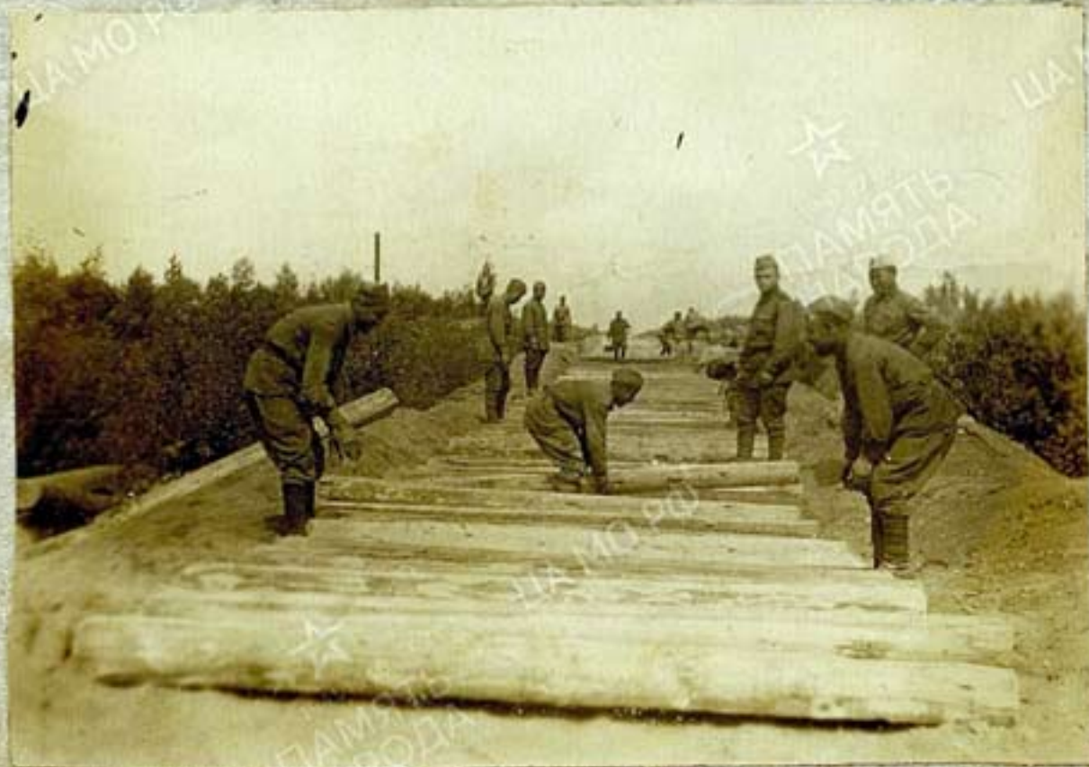
Раскладка шпал на линии Бугорный - Луки июль 1943