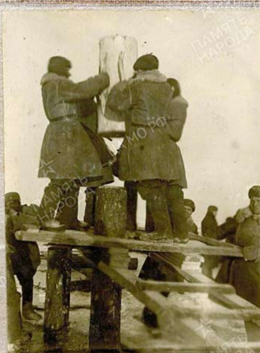
Декабрь - 1942 - Январь - 1943г.