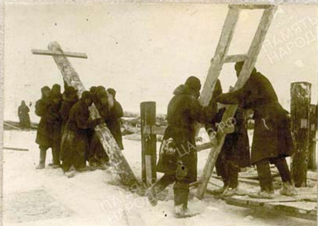
Подъем сваи и постановка ее по оси.