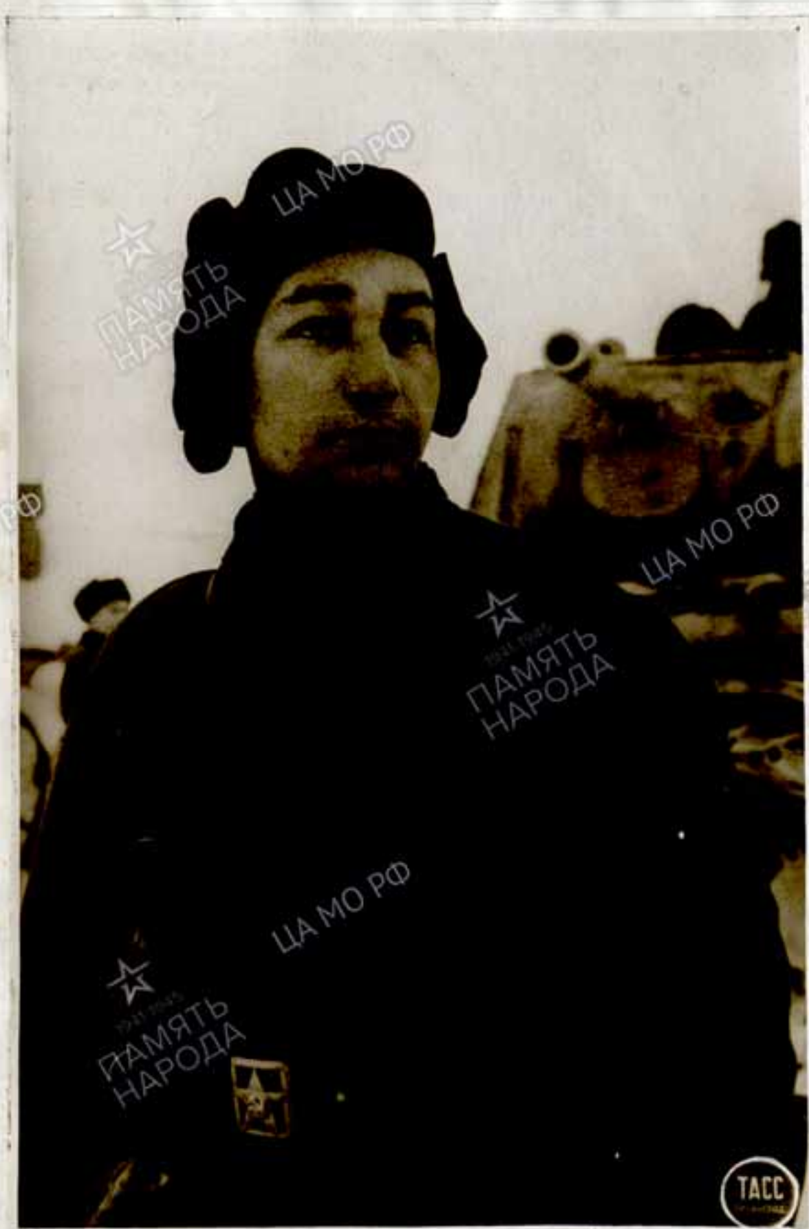
Командир роты старший лейтенант ОСАД ТИ, мастер по истреблению немцев, награжден- ный орденом ЛЕНИНА.